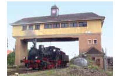
Bekanntes Stellwerk am Neustädter Hauptbahnhof.

Um den Exponaten in Zukunft mehr Platz zu geben und weitere Fahrzeuge instandsetzen zu können, ist seit einigen Jahren zusätzliches Gelände im Bereich des ehemaligen Bahnbetriebswerkes Neustadt an der Weinstraße erworben worden. Hier werden die baulichen Anlagen instandgesetzt und erweitert, so dass hier eine Werkstatt für den Fahrzeugunterhalt und Unterstellmöglichkeiten für nicht aufgearbeitete Fahrzeuge geschaffen werden.